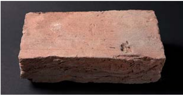
Källa 6. En tegelsten.