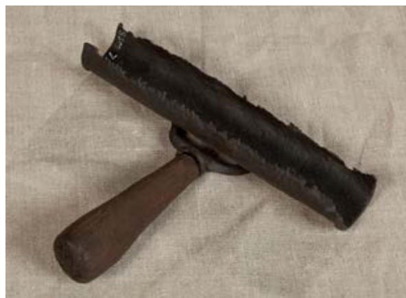
Källa 3. En skrapa för att rengöra (rykta) hästar.