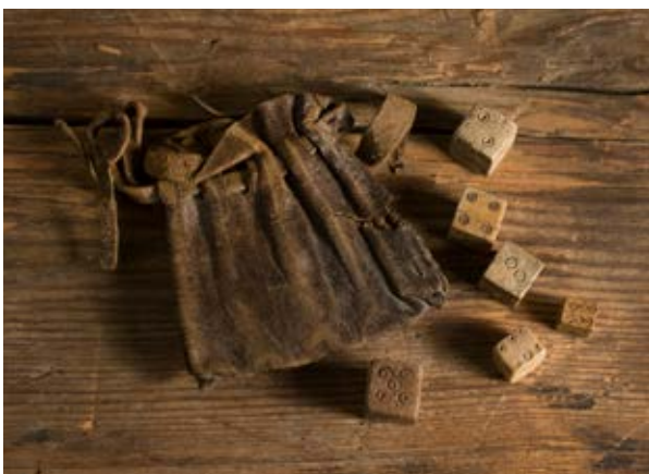
Källa 2. En påse av läder med tärningar.