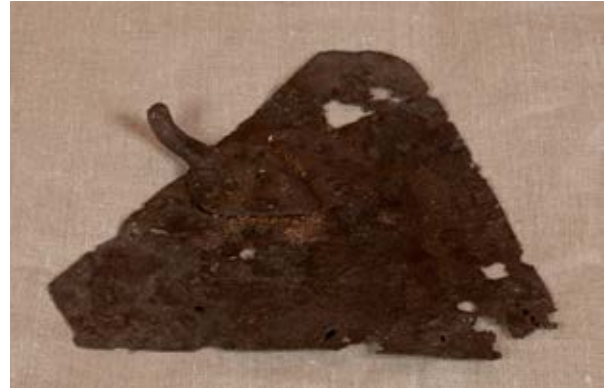
Källa 5. En murslev*.