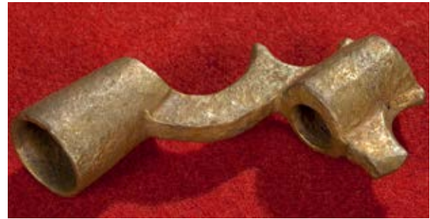
Källa 7. En ljusstake gjord av metall.