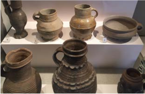
Källa 4. Olika krus* gjorda av lera från Tyskland.