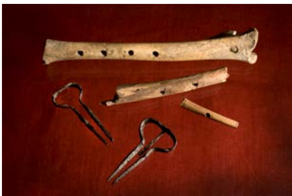
Källa 1. Några musikinstrument: tre flöjter och två mungigor.