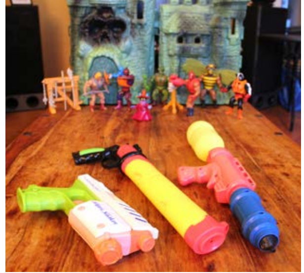
Krigsleksaker, tillverkade av plast.