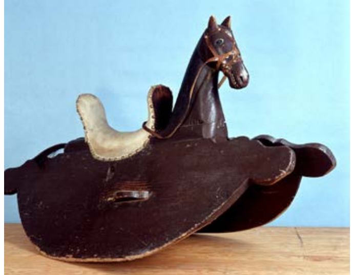
Gunhäst tillverkad av trä och läder.