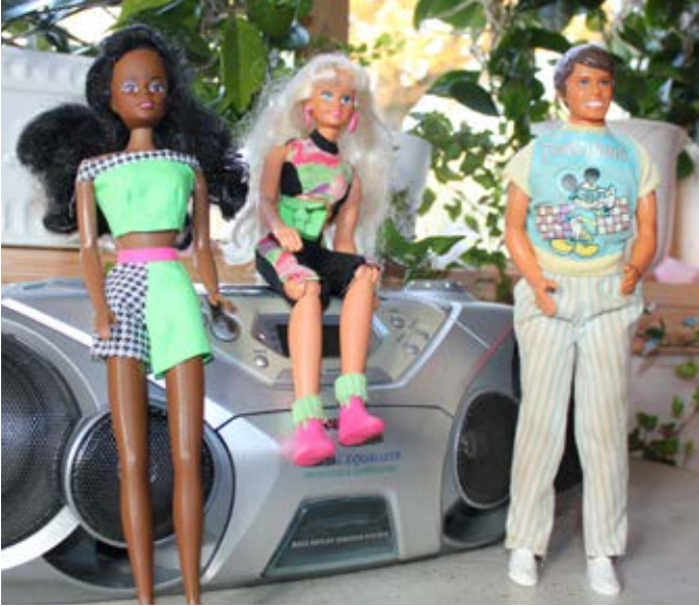
Tre dockor tillverkade av plast och tyg.

Tänk dig att de har hittats på golvet hemma hos ett barn som föddes i Hituna 2004.