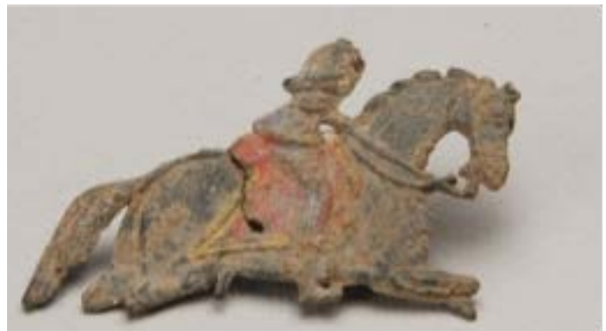
Soldat som rider på en häst. Tillverkad av metallen tenn.