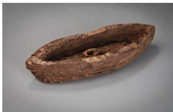
En båt tillverkad av bark från ett träd.