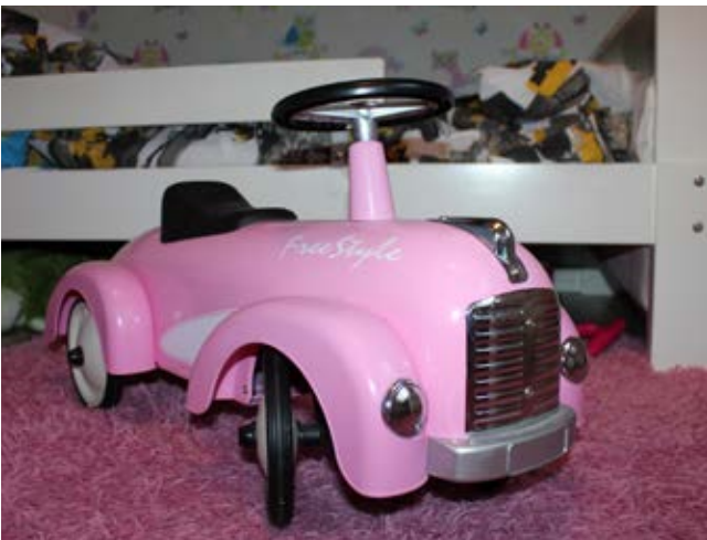
Sparkbil tillverkad av plast.