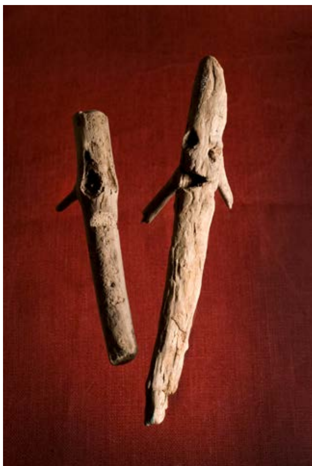
Två dockor tillverkade av träbitar.

Tänk dig att de hittats i marken under resterna av ett gammalt hus i Hituna.