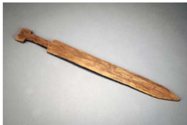
Ett svärd av trä.