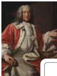
Arvid Horn, mösspartiet

Skriv ett F för frihetstiden, ett M för medeltiden, ett V för vikingatiden eller ett S för stormaktstiden i rutan under var och en av de åtta bilderna.