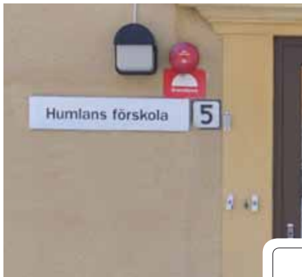
Namn på förskola

Sätt kryss i rutan på de tre bilder som visar att svensk eller nordisk historia har använts för att ge namn åt olika saker.