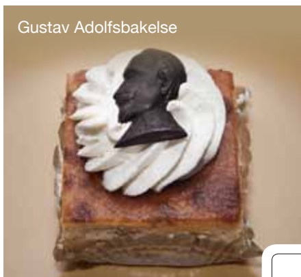
Namn på bakelse