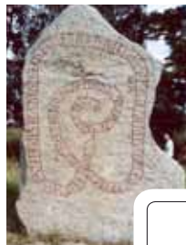
Runsten om Ingvar som reste till "Särkland"