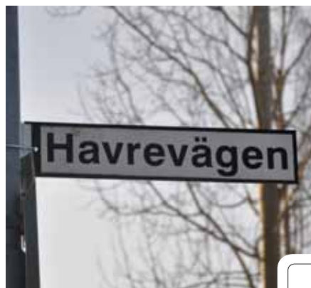
Namn på gata