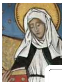
Den heliga Birgitta