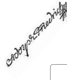
Stämpel med kung Adolf Fredriks namn