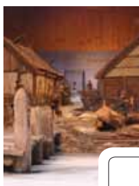
Hamnen i staden Birka