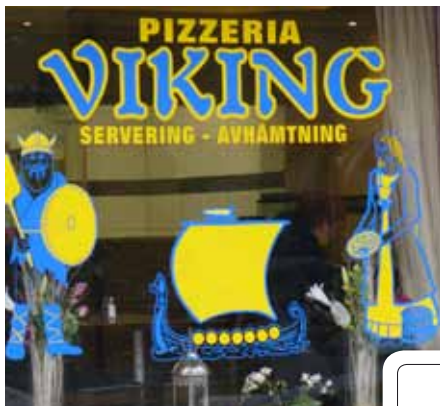
Namn på pizzeria