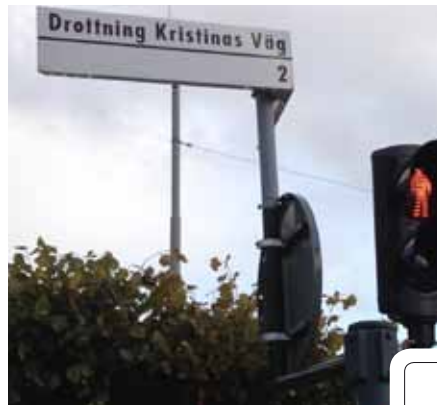
Namn på gata