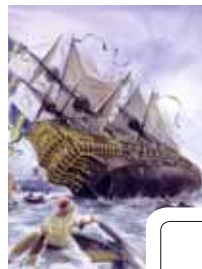
Regalskeppet Vasa sjunker