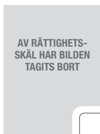
Häxprocesser, kvinnor pekades ut som häxor