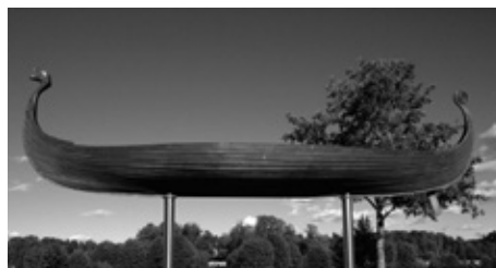
Vikingaskepp, modell i Upplands Väsby