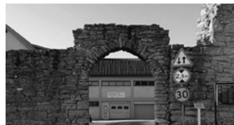
Muren runt Visby på Gotland