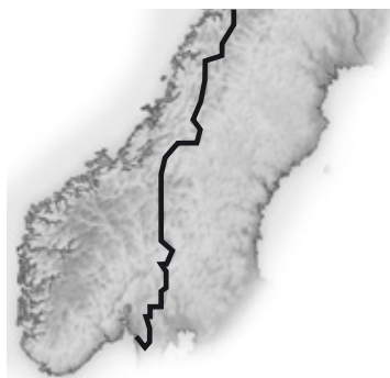
Gränsen mellan Sverige och Norge