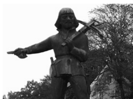
Nils Dacke, staty i Virserum