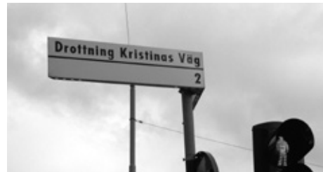
Drottning Kristinas väg, vägskylt