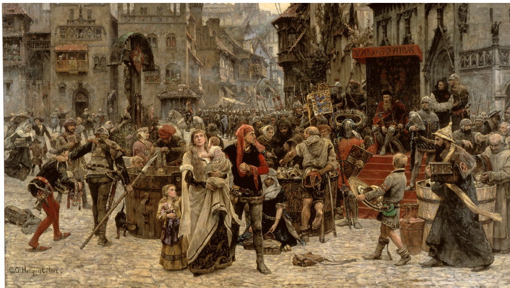
1882 målade Gustaf Hellqvist den här tavlan som heter Valdemar Atterdag brandskattar Visby 1361 .