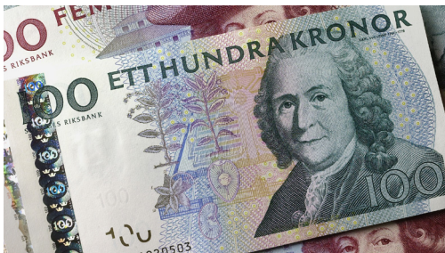
Carl von Linné på 100-lappen

Kryssa för rätt ruta för varje bild. Gör som i exemplen.