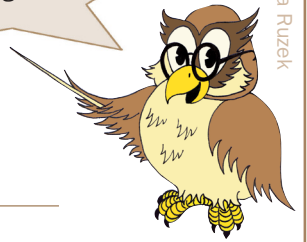
Illustration: Monika Ruzek

Berätta vad som kan vara viktigt att tänka på och förklara noga hur det går till!