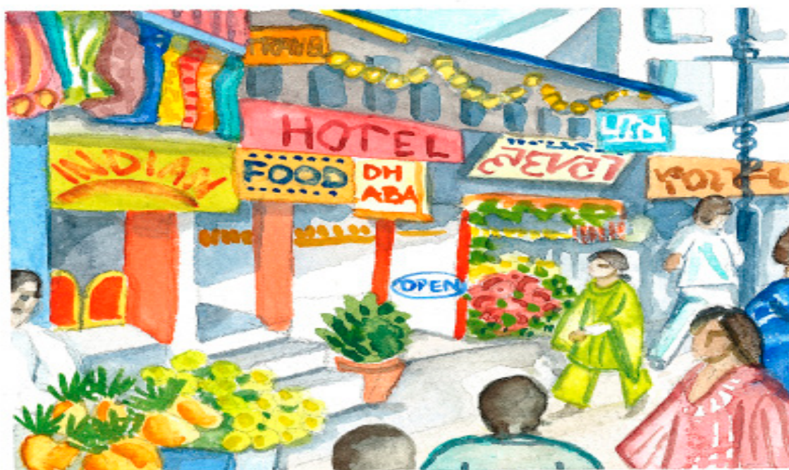
Illustration: Margaretha Häggström