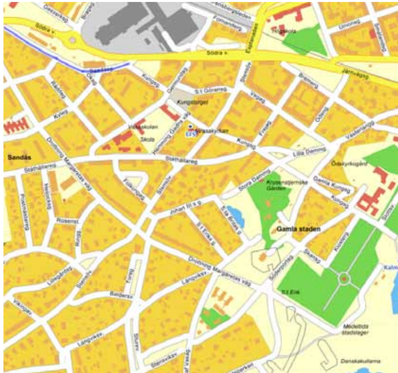
Drottning Margaretas väg, Folkungagatan, S:t Eriksgatan, S:ta Brittas gata, Linnégatan, Sturevägen, Odengatan och Unionsgatan är några av gatorna med historisk anknytning som finns i Kalmar.

Varför finns det i de flesta städer gatunamn, torg eller andra platser uppkallade efter historiska personer eller händelser?